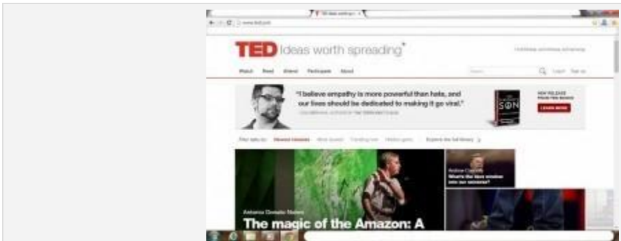
نمایی از سایت تد